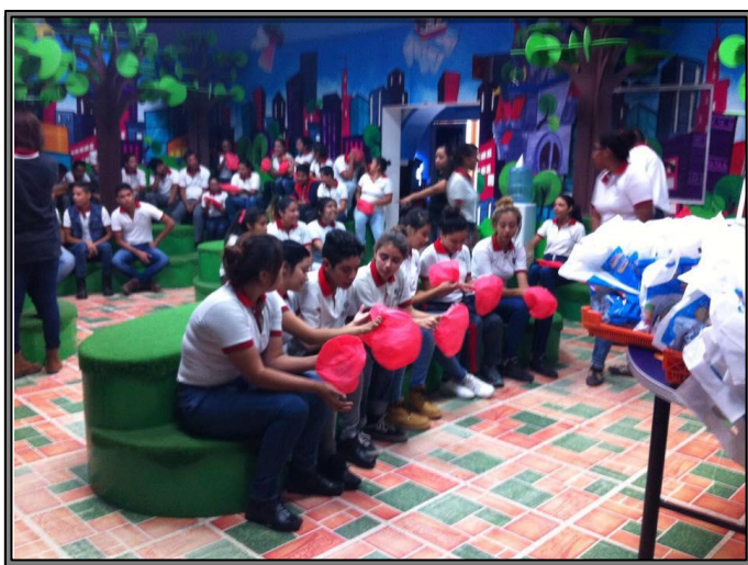
Visita de los alumnos a la empresa Grupo BIMBO S.A. DE C.V. Planta Marinela de Occidente. Ubicada en Camino al Colli #2892 Col. Pról. Jardines del Sol. El objetivo de esta visita fue que los alumnos del plantel a través de la materia de química, conocieran el proceso y elaboración de los productos, así como las normas y condiciones de calidad e higiene que exige una empresa.