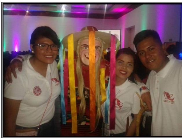
XVIII Festival de Arte y Cultura. Chiapas 2016. En donde nuestros alumnos representaron a nuestro estado. En las categorías Pintura, Oratoria y Declamación. Marzo 2016.