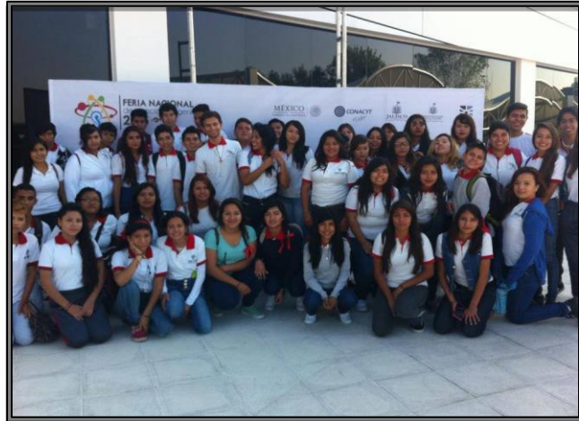
Asistencia de los alumnos a la Feria Nacional de Ciencias e Ingenierías. Noviembre de 2015.