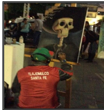
Encuentro Estatal Noviembre 2015. Categorías Pintura y Escultura. En el que nuestros representantes obtuvieron el 1º lugar en Pintura y el 3ºer lugar en escultura.