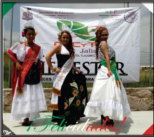
Evento: Señorita fiestas Patrias 2015. Septiembre de 2015.

Algunas de las actividades de nuestro Plantel, que son más relevantes en el mencionado ciclo escolar, son las siguientes: